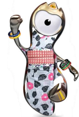
盛夏だ浴衣のユニ フォームを着て入場したら