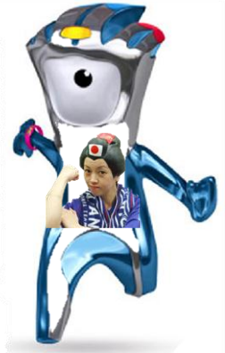
女性が強かった なでしこ、火の鳥+