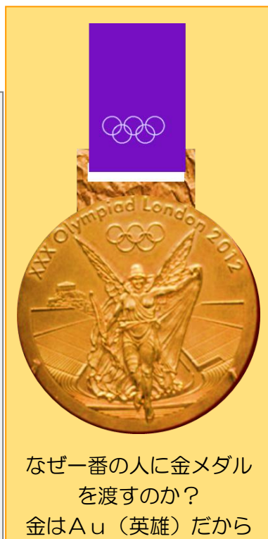
なぜ一番の人に金メダル を渡すのか？ 金はAu（英雄）だから