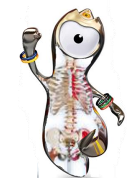
がんばった選手は骨休めしよう！