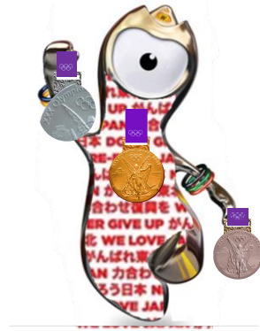
手ブラでは帰さない