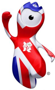
英国旗 ユニオンジャック

このオリンピックを盛り上げていたマスコットキャラクター「ウェンロック」と「マンデビル」をご存知ですか？「ウェンロック」は、近代オリンピックの概念が生まれたシュロップシャー州の街「マッチ・ウェンロック」から名づけられ、「マンデビル」はパラリンピック発祥の地イングランド南部の「ストーク・マンデビル」に由来。両キャラクター共、顔にはカメラのレンズに見立てた大きな目が1つあり、この一つ目の奇妙なマスコットキャラクターの衣装を替え、見た目を色々と変えて、五輪の余韻を楽しんでみた。まずは開催国英国に敬意を表して・・・