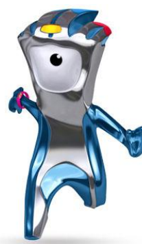
基本形 マンデビル