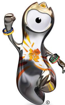
基本形 ウェンロック