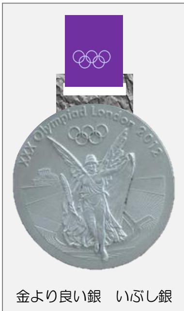
金より良い銀 いぶし銀

38個の最多のメダルを獲得した選手が銀座をパレード。この日は銀座・銀座・銅座だ。 世界記録を出したらレアメタル、メダル取りに「失」敗した人には「鉄」のメダルをあげたら。 鉄は錆びるからダメ？ 錆びても良いのです。 なぜなら「オリンピックは参加（酸化）することに意義がある」から・・・