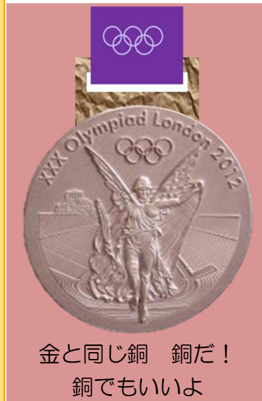
金と同じ銅 銅だ！ 銅でもいいよ