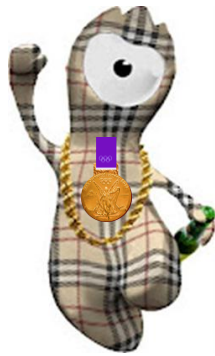
英国ブランド バーバリーチェック