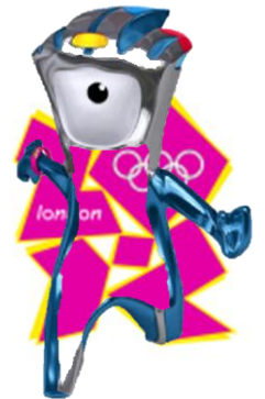
ロンドン五輪 ロゴマーク