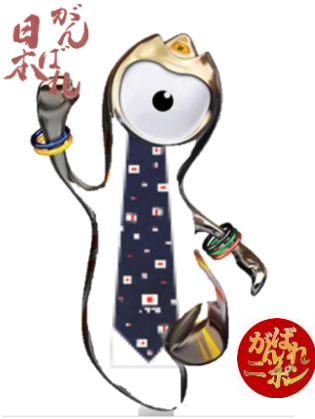
がんばれニッポン