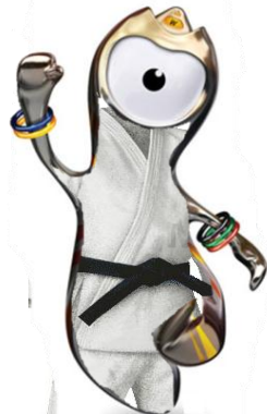
柔道ニッポン、金メダル女性の一本のみ 金なしの男子柔道、柔の道より茨の道、 白旗上げるな！ ハイ JUDO♪